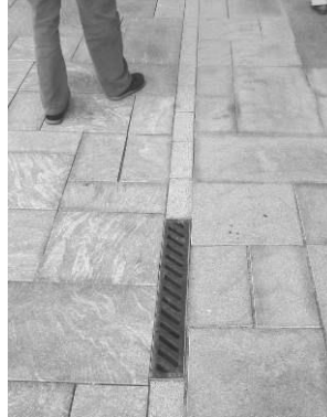
I en granitbelægning