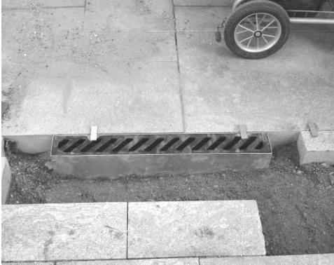
Udløbskassen sættes som en kantsten