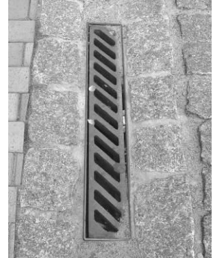
I et Chausséstensbånd