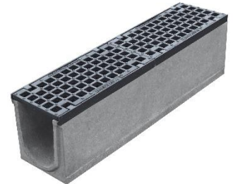
Maskerist i støbejern Indløbsareal 860 cm 2 /m Slidsbredde 30/23 mm