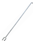
Ristekrog Varenummer 7009900