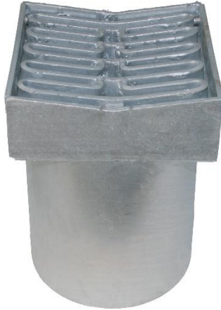
Karmål: 320 x 300 mm