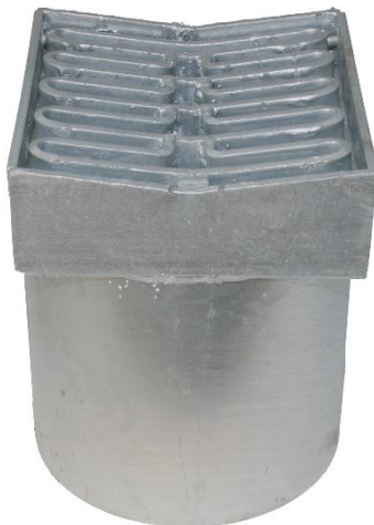
Karmål: 320 x 300 mm